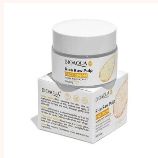
Crema Facial Precio:16.000 AGOTADO