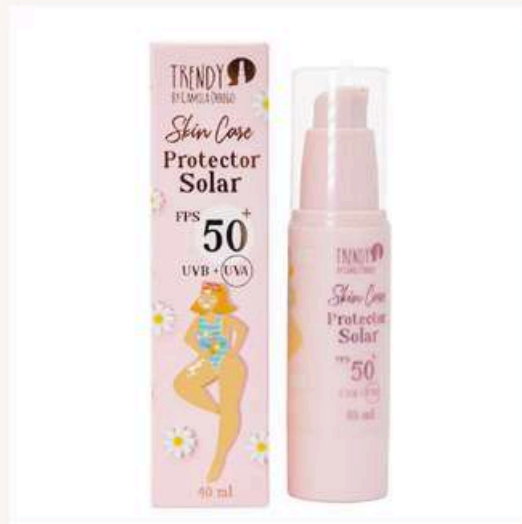
Protector solar facial