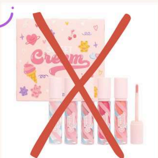
Kit Glosses Sweet Antes:35.000 Ahora:25.000