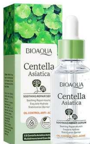
Serum Facial Precio:10.000