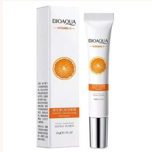
Contorno Ojeras y Bolsas Precio:9.000 AGOTADO