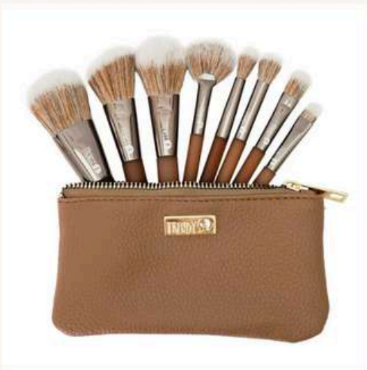
Kit Mini Café Antes:40.000 Ahora:30.000