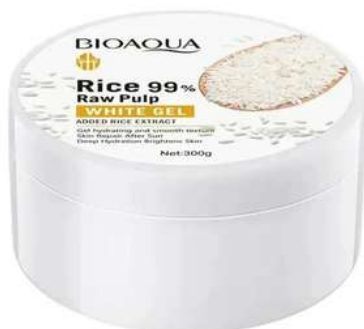
Gel Hidratante Precio:16.000