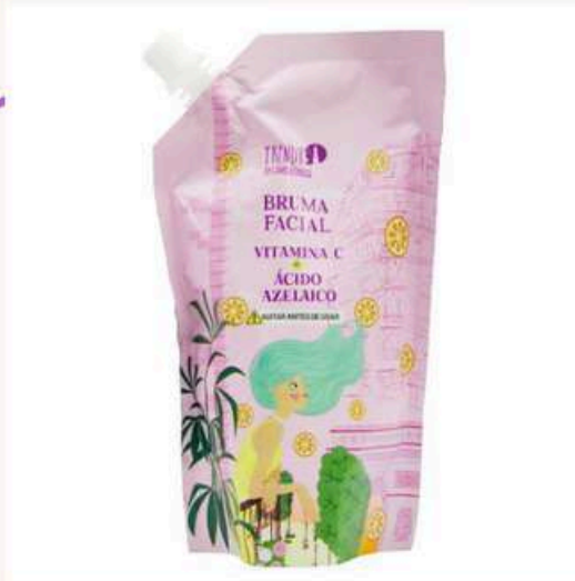
Doypack Vitamina C