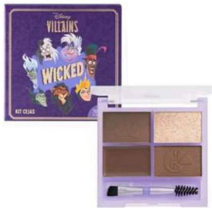
Kit Cejas Villanos