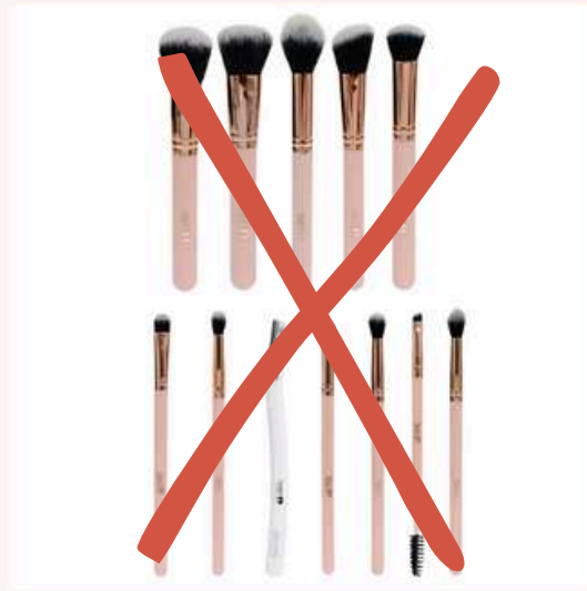
Kit Everyday Antes:45.000 Ahora:35.000