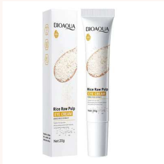
Contorno Ojeras y Bolsas Precio:8.000 AGOTADO