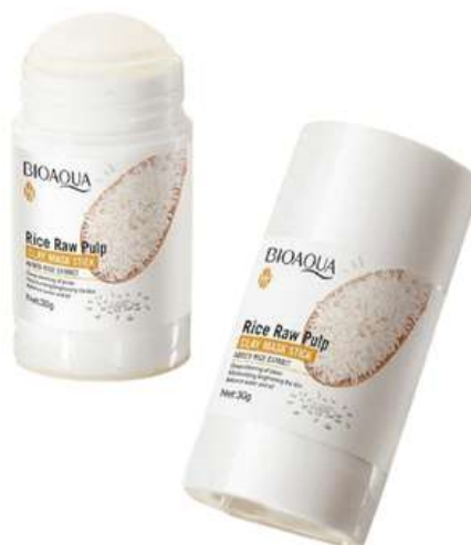
Mascarilla en Barra Precio:10.000 AGOTADO