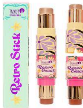
Rubor iluminador barra