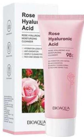
Jabón Facial Precio:14.000