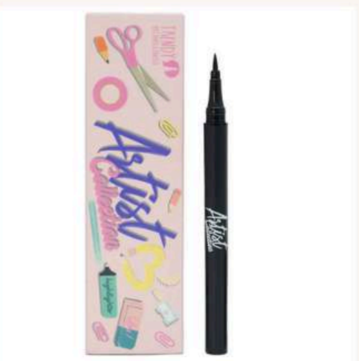
Delineador Negro Antes:20.000 Ahora:15.000