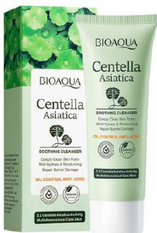
Jabón Facial Precio:14.000 AGOTADO