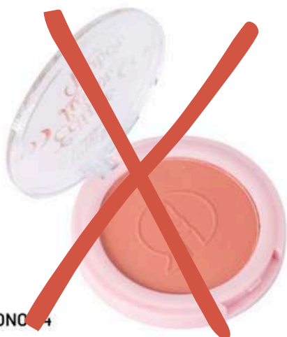
Rubor Eclipse 04