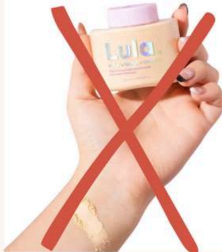
Polvo suelto lula