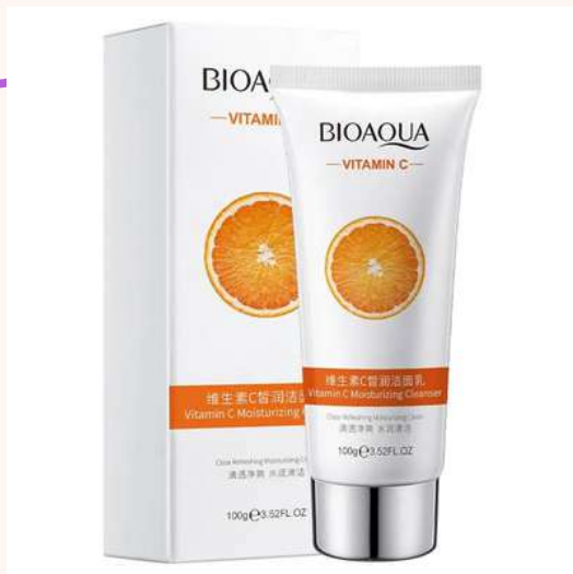
Jabón Facial Precio:14.000