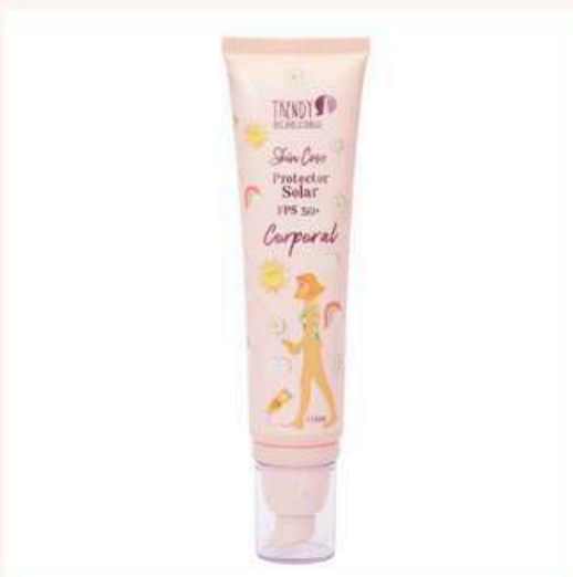
Protector solar corporal