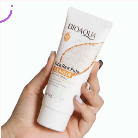
Jabón Facial Precio:14.000