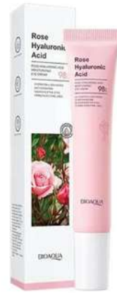
Contorno Ojeras y Bolsas Precio:8.000 AGOTADO