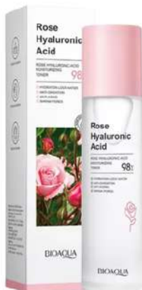
Tónico Facial Precio:15.000

Línea Facial Rosas y Ácido Hialurónico Bioaqua