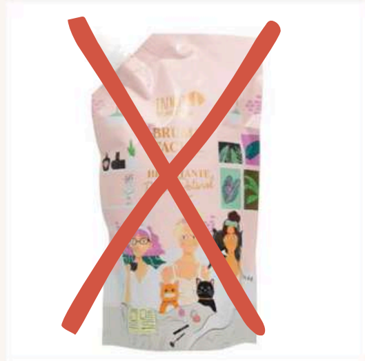
Doypack Bio Retinol