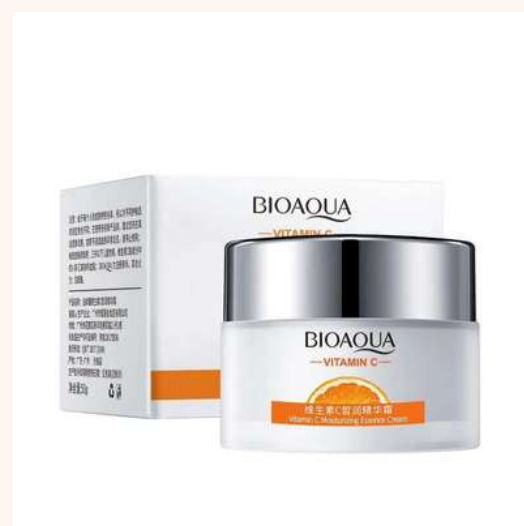
Crema Facial Precio:15.000 AGOTADO