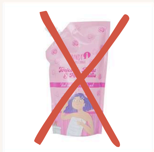
Doypack tónico rosas