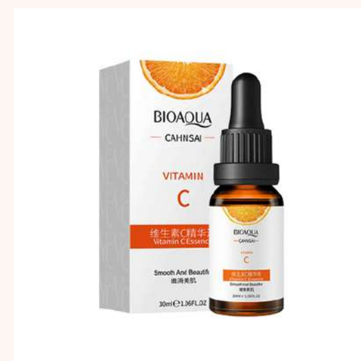
Serum Facial 30ml Precio:10.000