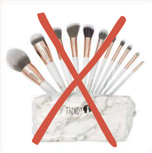
Kit x11 Blanco Antes:70.000 Ahora:45.000