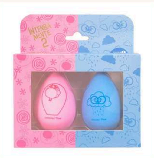
Esponja x2 intensamente