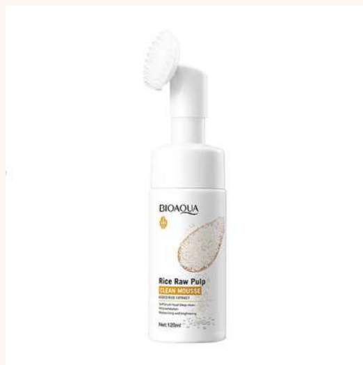
Espuma Limpiadora Precio:16.000 AGOTADO