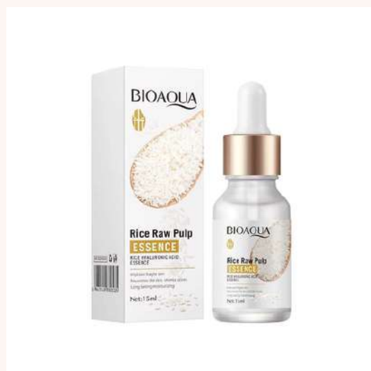
Serum Facial 15ml Precio:9.000