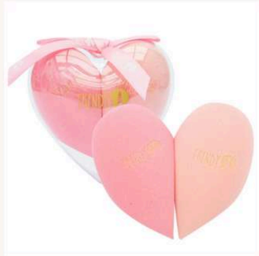
Esponja x2 corazón