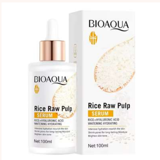
Serum Facial 100ml Precio:16.000