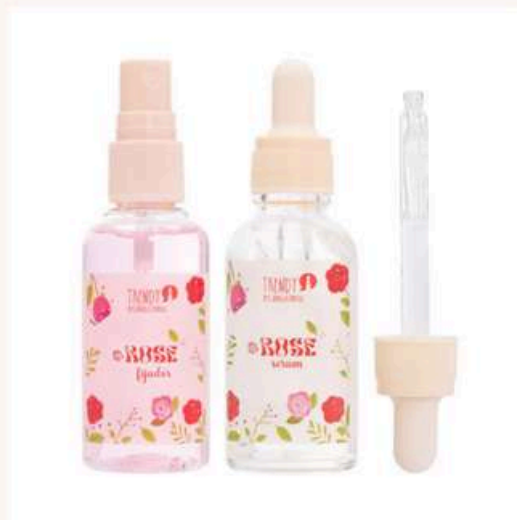
Kit primer y fijador