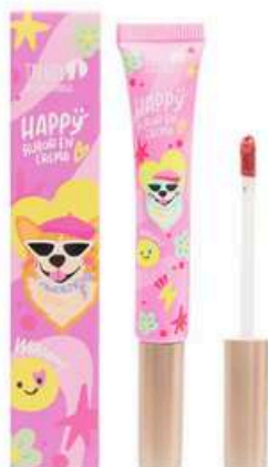
Rubor crema Happy