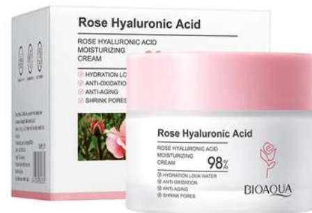
Crema Facial Precio:16.000