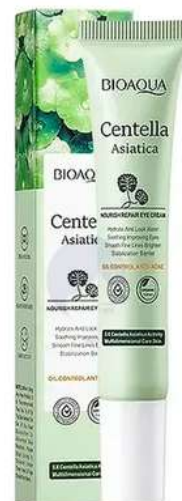
Contorno Ojeras y Bolsas Precio:8.000 AGOTADO