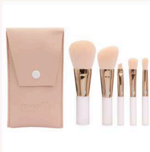
Kit Mini Cristal Antes:25.000 Ahora:15.000