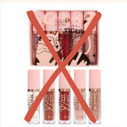
Kit Labios Tiger Antes:35.000 Ahora:25.000