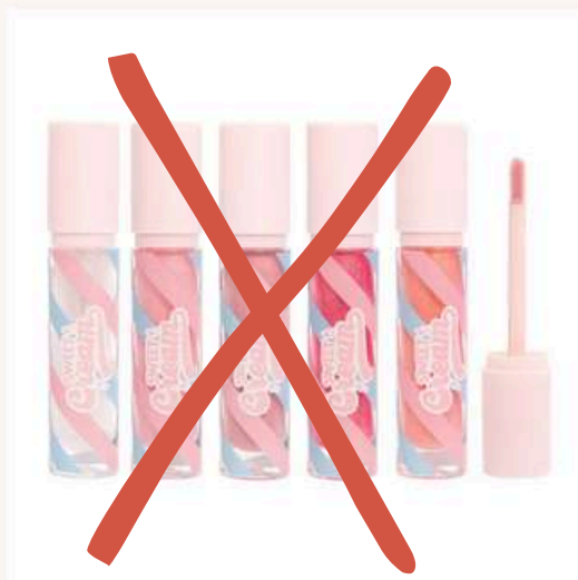
Gloss Sweet unidad Antes:12.000 Ahora:6.000