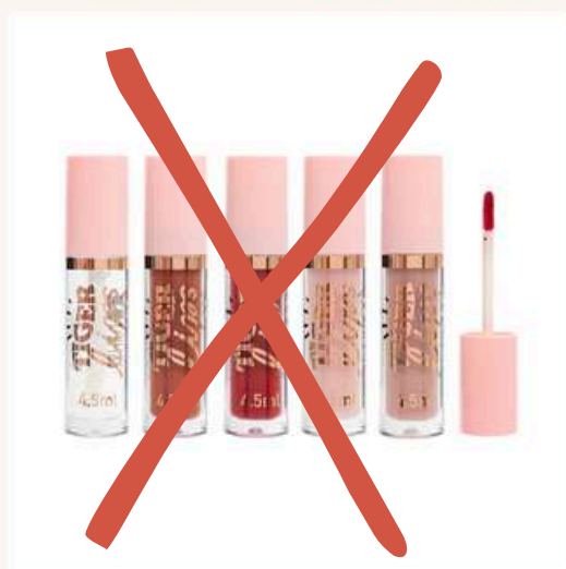
Tiger Lips unidad Antes:12.000 Ahora:6.000