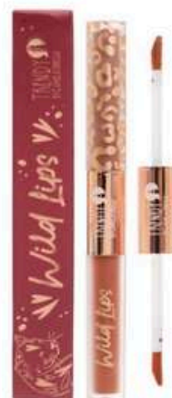
Labial Doble Velvet