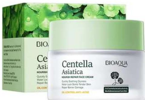
Crema Facial Precio:16.000 AGOTADO