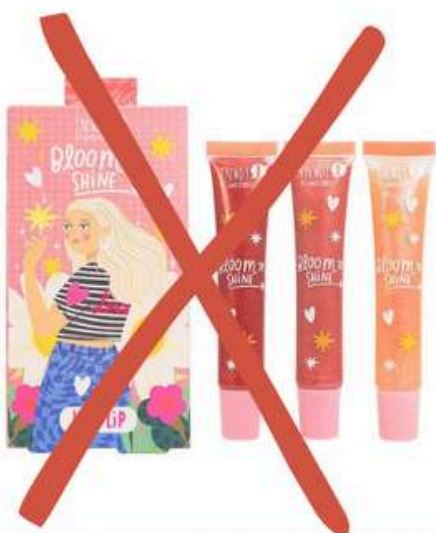
Kit x3 Brillos