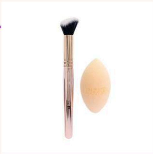
Kit perfect duo Antes:15.000 Ahora:9.000