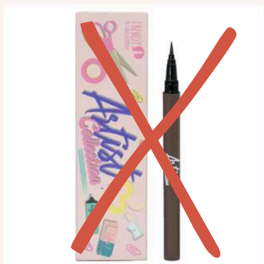
Delineador Café Antes:20.000 Ahora:12.000