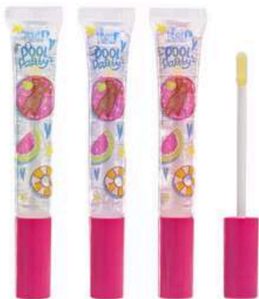
Brillo Pool Party