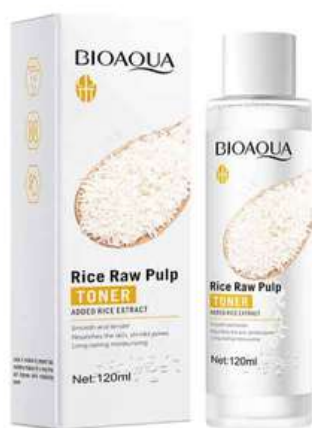
Tónico Facial Precio:12.000