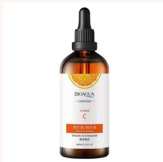
Serum Facial 100ml Precio:8.000