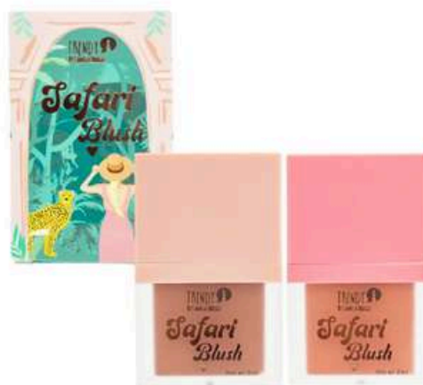
Rubor x2 Safari