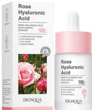
Serum Facial Precio:10.000