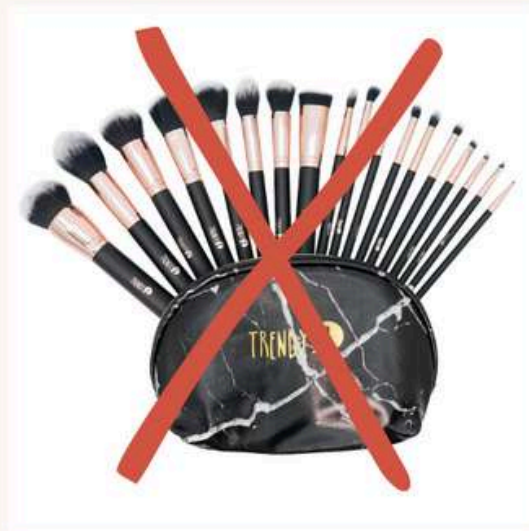
Kit x18 Negro Antes:100.000 Ahora:60.000