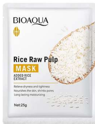
Mascarilla Precio:1.000 AGOTADO