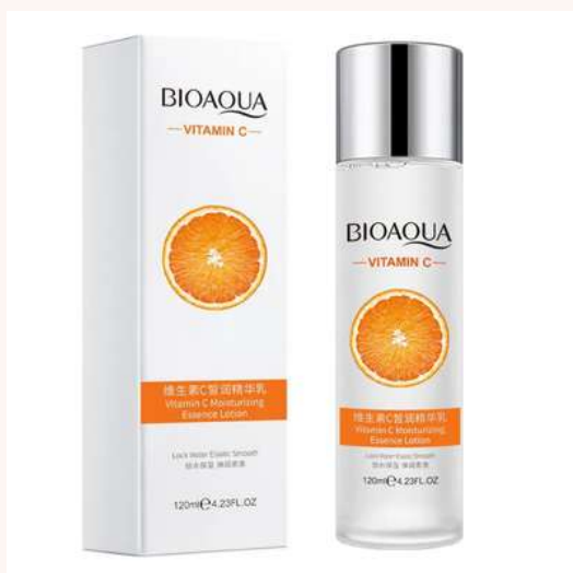
Tónico Facial Precio:12.000 AGOTADO