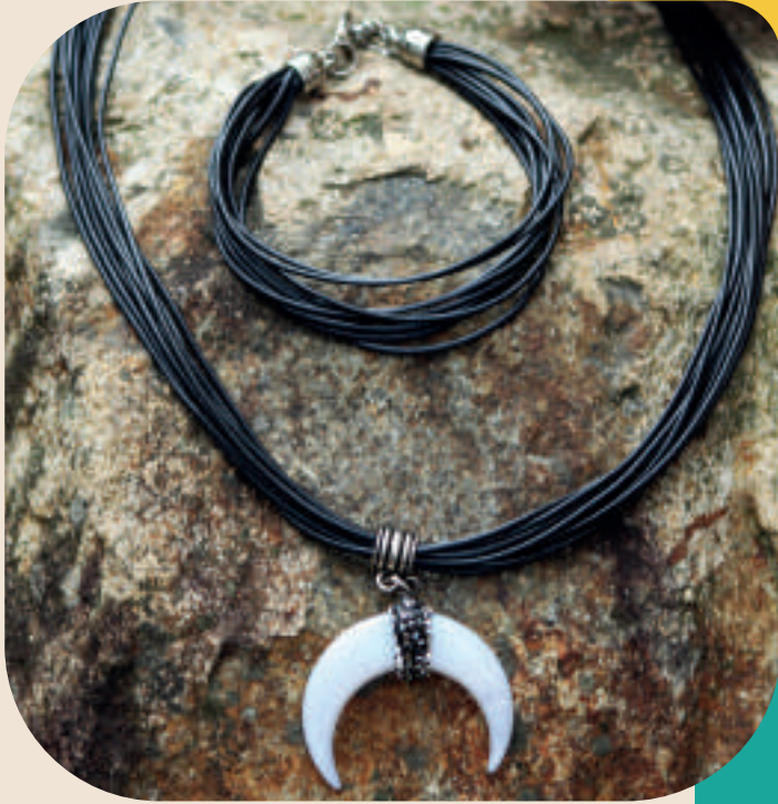
Ref: 12-C Collar, cordón vibora, dije en nácar. Precio: $35.000 incluye manilla