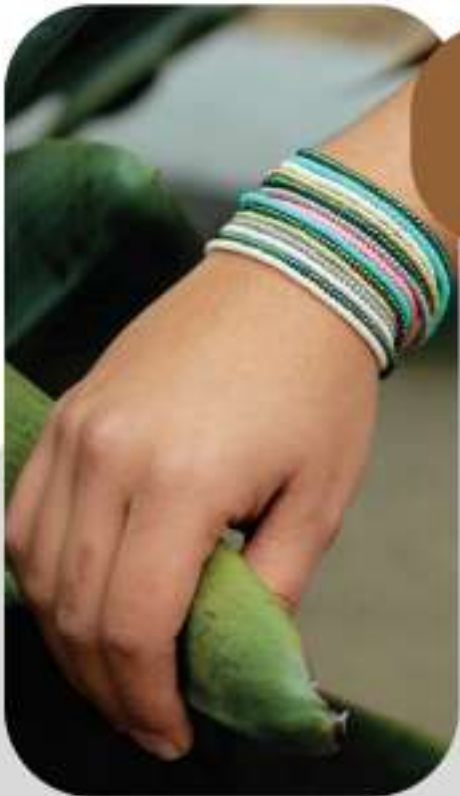
Ref: 37-M mostacilla original colores: verde, azul, amarillo, negro precio:$ 25.000