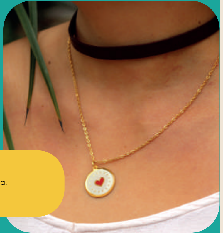
Ref: 13-C Cuero plano, cadena en acero, dije en resina. Precio: $35.000