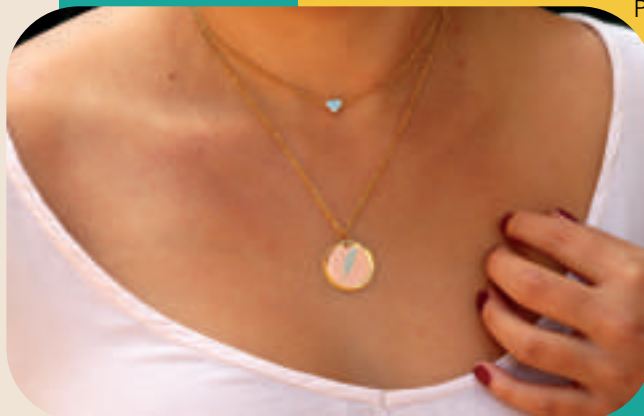
Ref: 15-C cadena en acero, dije en oro golfi y resina. Precio: $35.000