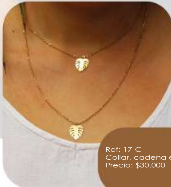
Ref: 17-C Collar, cadena en acero, dijes en oro golfi. Precio: $30.000