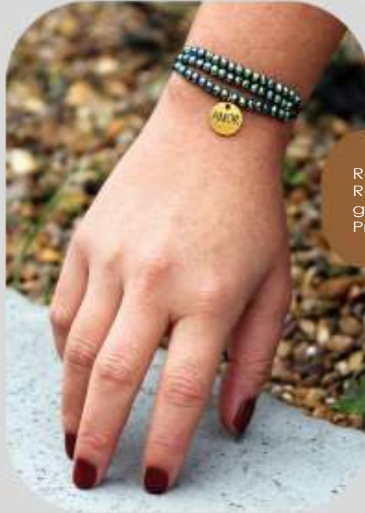
Ref: 38-M Rondela en vidrio , dije en oro golfi, cierre ajustable. Precio: $25.000