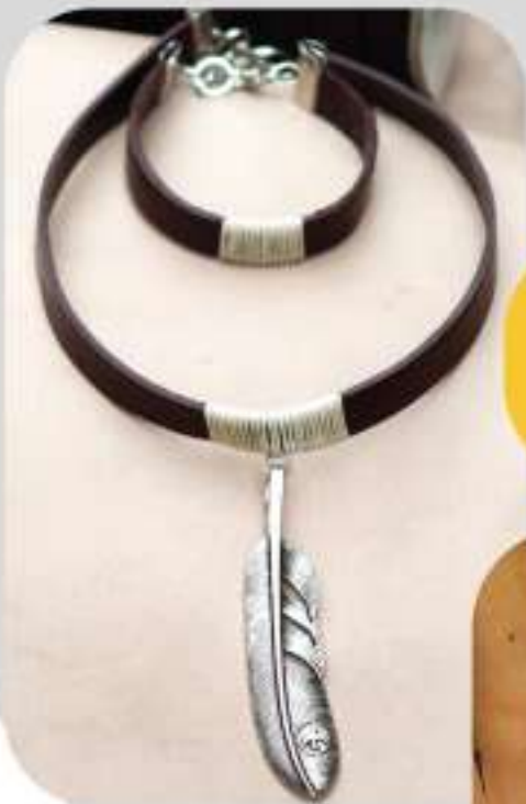
Ref:16-C Collar en cuero plano, dije en nikel. Color: Café y negro. Precio: $35.000