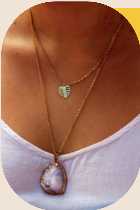
Ref: 14-C cadena en acero, dijes en oro golfi, piedra drusa. Precio: $38.000